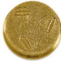
n.191 Gnocchetti sardi mm 19