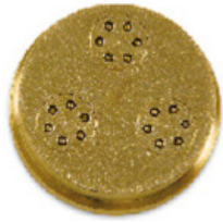
n.91 Gramigne mm 3