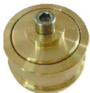
Sfoglia regolabile Adjustable sheet Fuille réglable Hoja ajustable