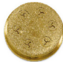
n.240 Fusilli 8,4