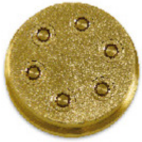
n.77 Maccheroni rigati mm 8