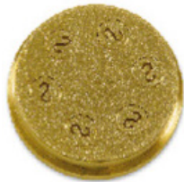
n.220 Caserecce Strozzapreti mm 8,8