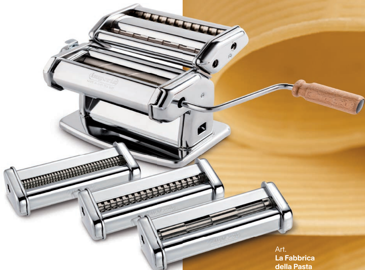
Art. La Fabbrica della Pasta Cod. 5501