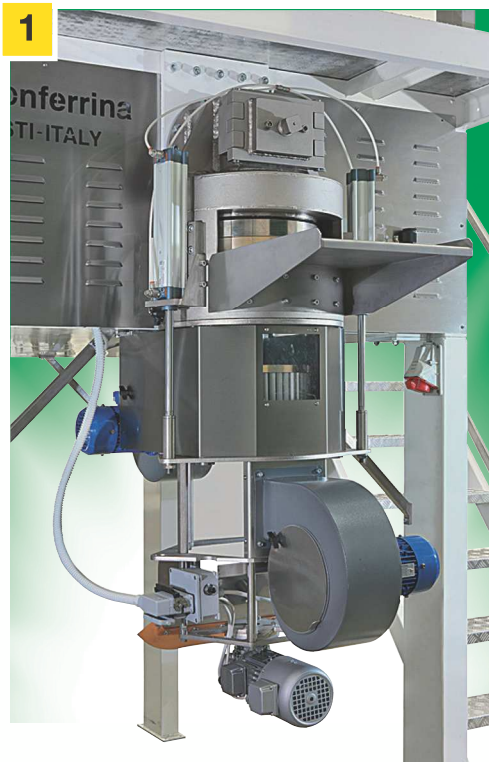
1 - Particolare testa estrusore con trafile penne